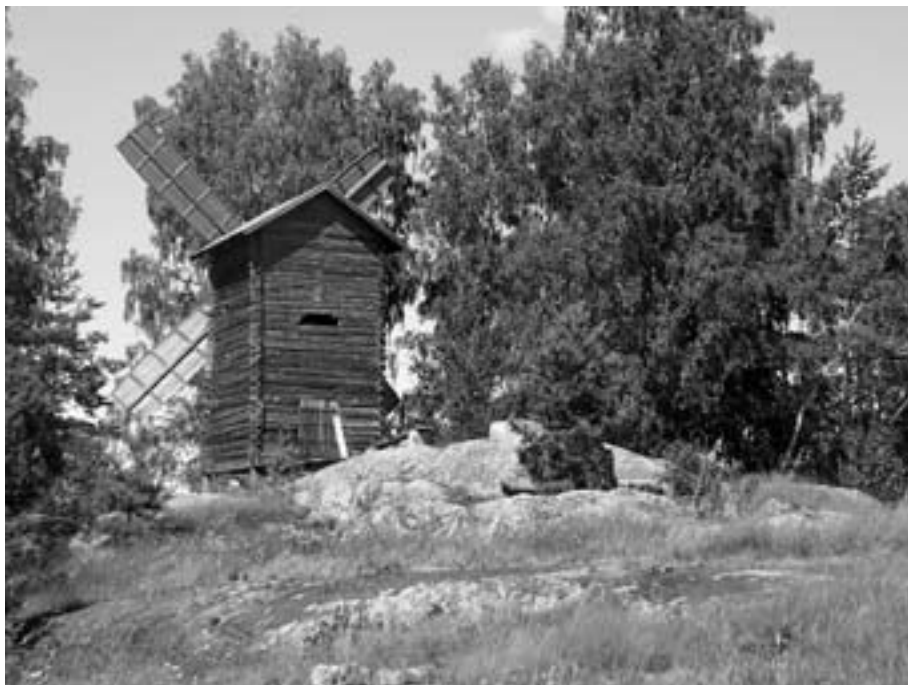
Huttulan tuulimylly kunnostettiin 2000-luvun alussa, ja myllymäki on sen jälkeen toiminut mm. juhannusjumalanpalveluksen pitopaikkana.