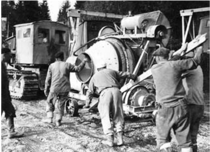
Muuttoapuna von Herzenin betoniasemalle.