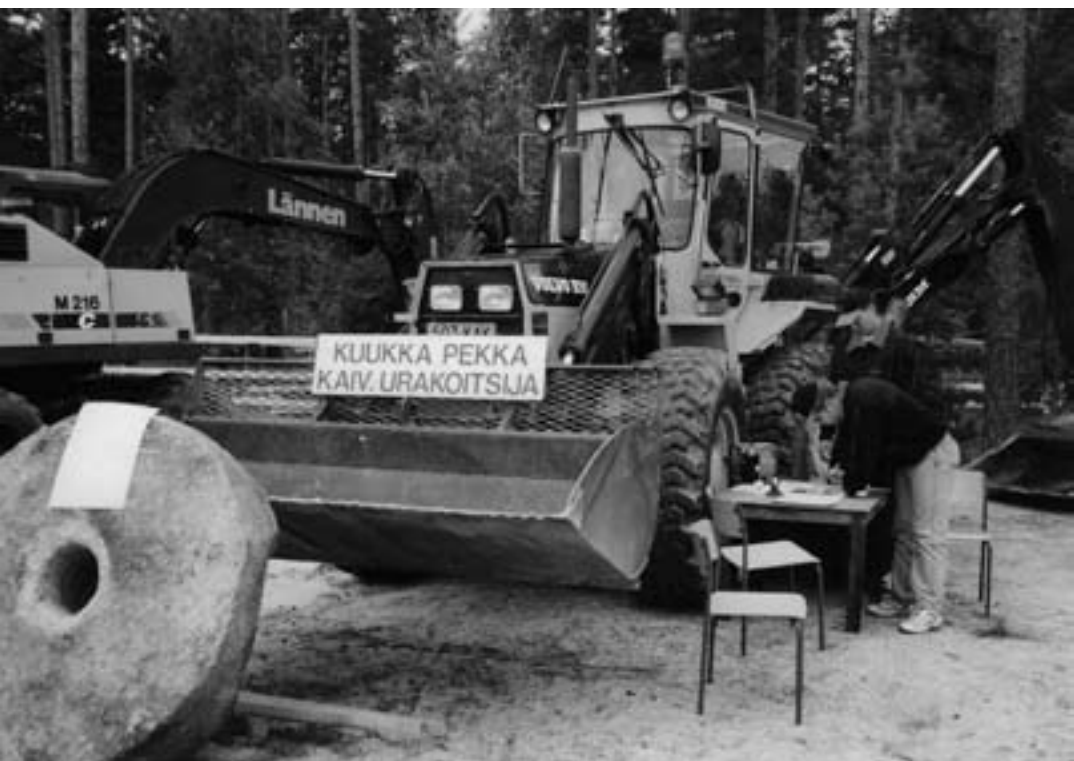
Pekka Kuukan osasto Lemin messuilla.