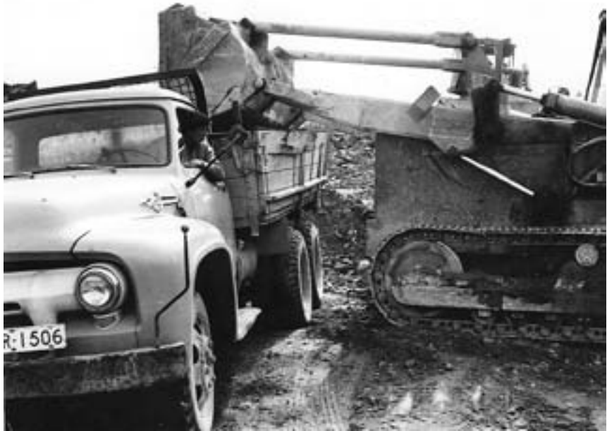
Kuorman tekoa Väinö Kapiaisen Bedfordiin.