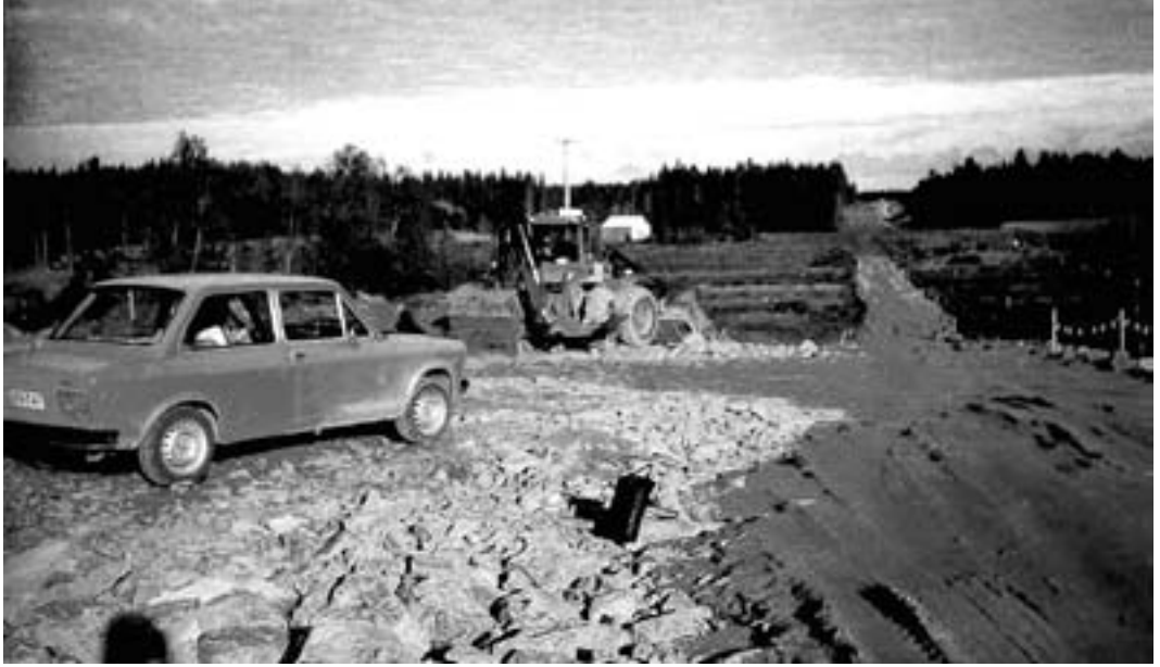
Tenho Kärmeniemen kanssa Pekka Kuukka teki huoltotien heinäpellon poikki tulevalle putkityömaalle Lappeella.