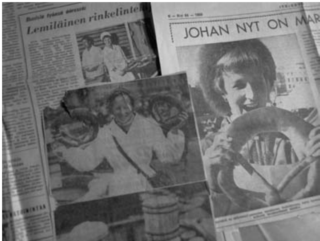
Seja Rasa ja lemiläiset rinkelit ovat olleet lehtienkin palstoilla.