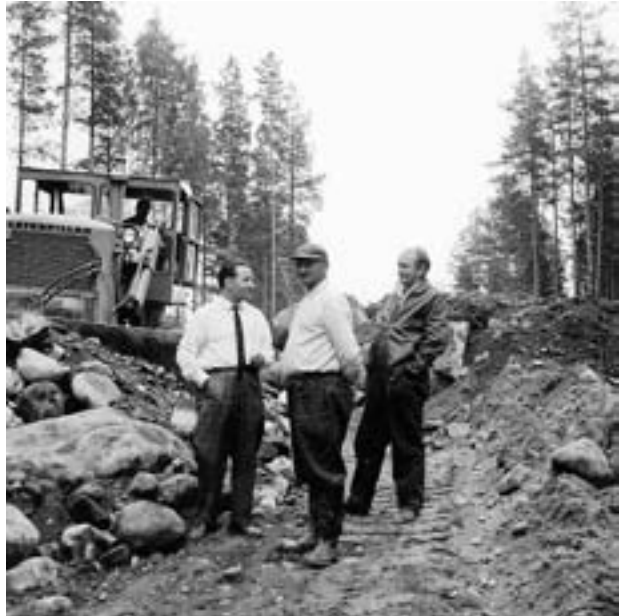
Caterpillarin jälkeä tutkaillaan työmaalla.