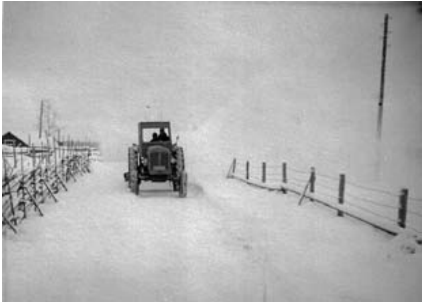
Kylätien kunnossapito oli myös Vilhujen hommaa.

– Se oli tosiaan varmaan 1960-luvun alkupuolta, kun Raivin perustettiin ja Raivinin nimissä alkoi se oma urakointi. Yksityisteitä kunnostettiin valtiolle, pyrkimys isällä oli, että joku yksityistien