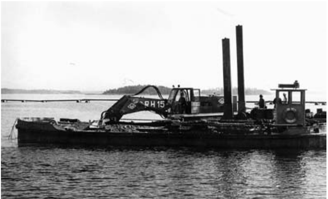
Kauharuoppaja Kaukaan edustalla noin vuonna 1970. Ruoppa oli Suomen suurin.