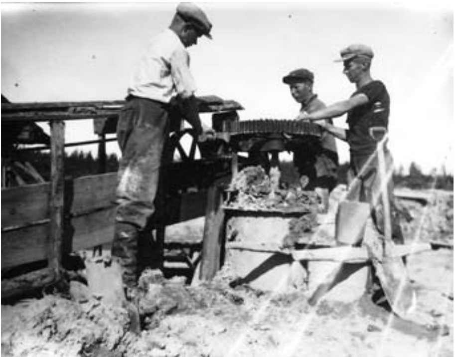
Savimylly on vielä Vilhuilla tallessa.