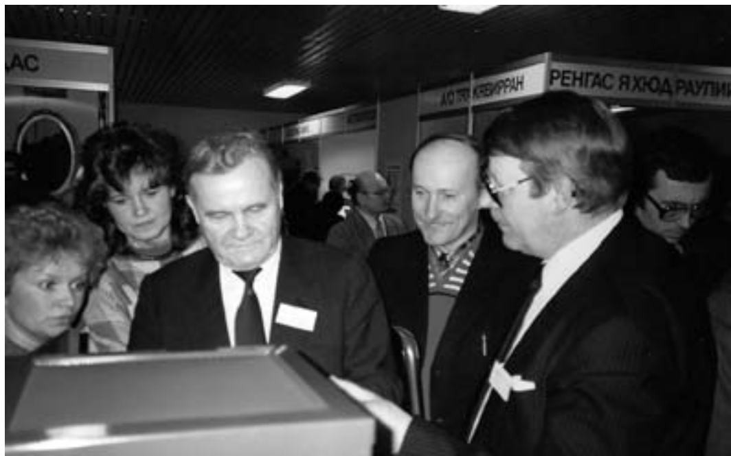
Venäjän kaupan kulta-aikaa.