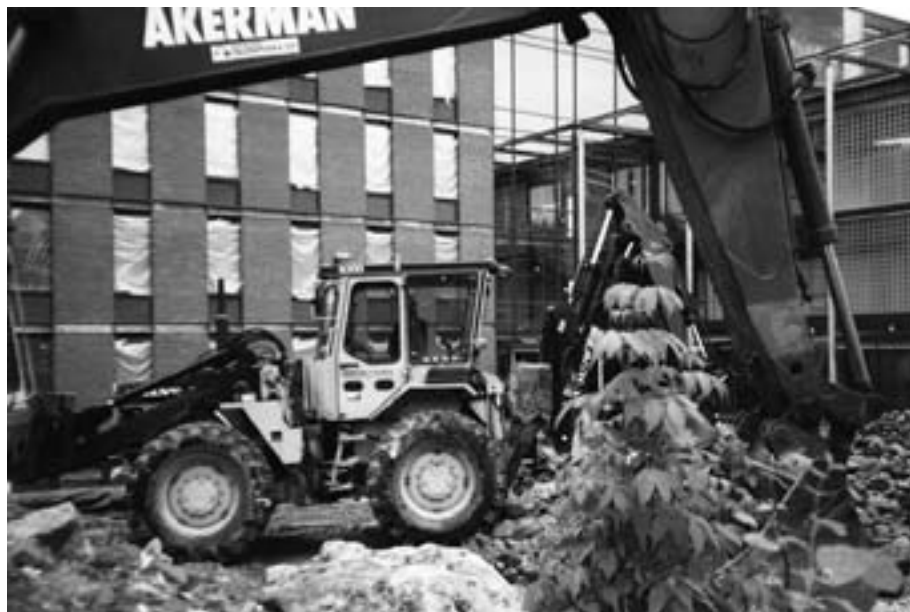
Yliopiston työmaalla.