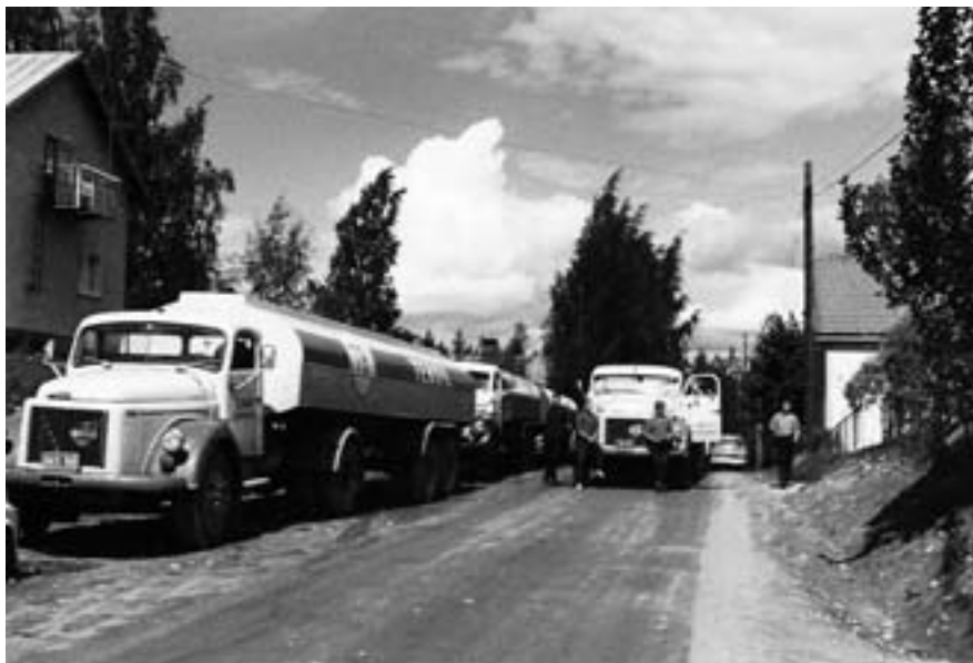
Kalustoa ja kuljettajia Lappeenrannan Honkakadulla, Sinkon talon nurkalla.