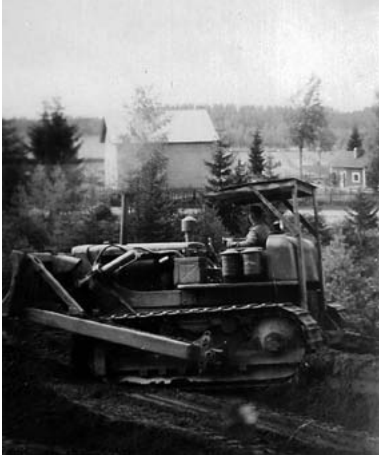
Pellonraivauksen Caterpillar antoi sytykkeen Toivo Tuuliaiselle hankkia maansiirtokoneita. Tässä Pellonraivauksen kone tekemässä Kapiaisen sementtivalimon pohjaa vuonna 1954.