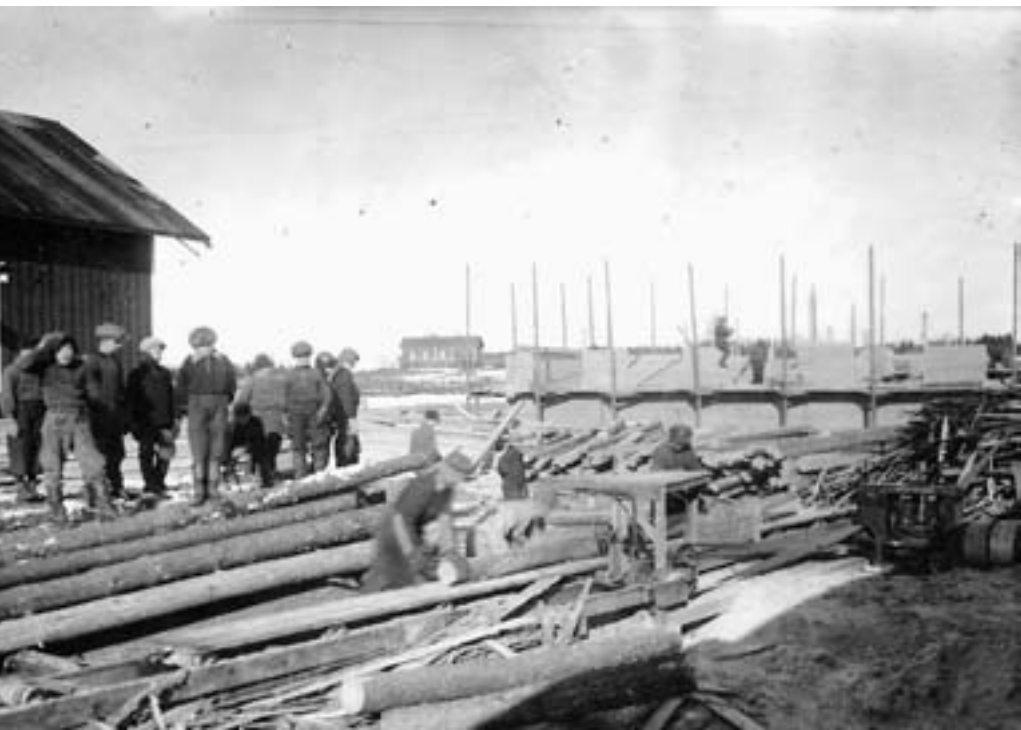
Kytölän koulun työmaalla.