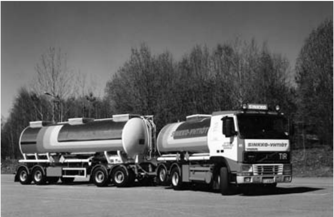
Sinkko-yhtiöiden uutta kalustoa ennen yhtiöiden myyntiä.