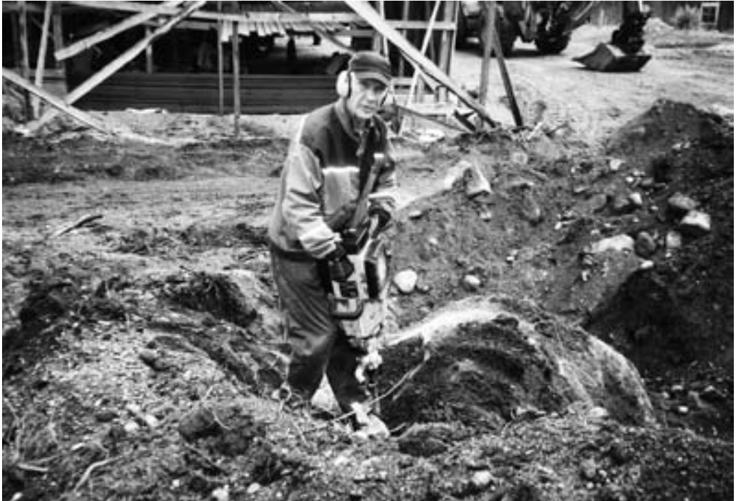
Välillä tarvitaan myös kalliopora.