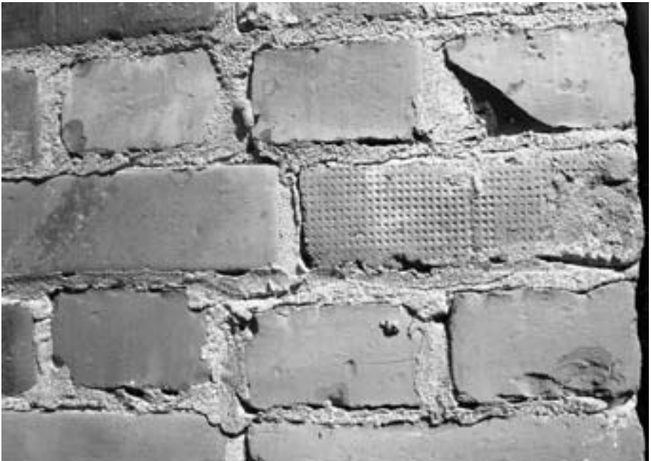
Tuuliaisen mylly Toukkalassa on rakennettu Vilhun tiilistä. Kuva myllystä sivulla 95.