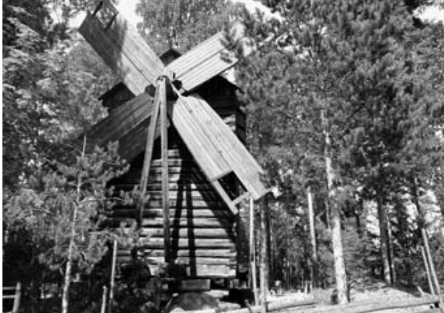
Lemin kotiseutumuseon mylly on peräisin Muhlin mäeltä, jonne se tuotiin Taipalsaareltä.