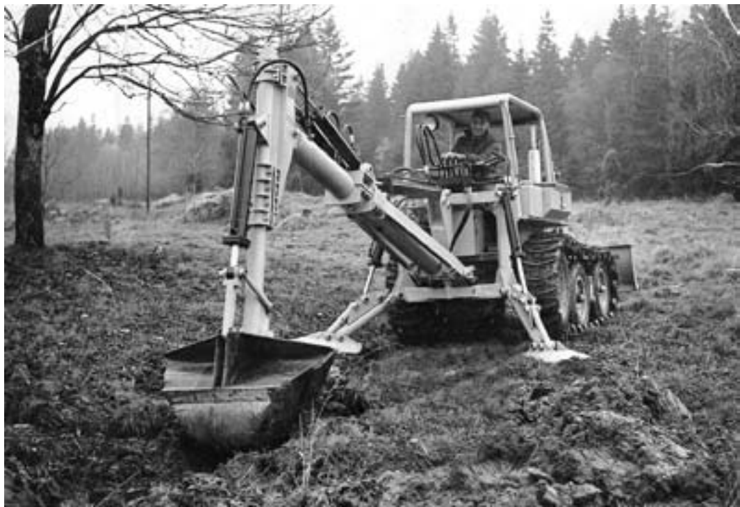
Ilmo Tiainen kaivaa Pamsella ojaa.