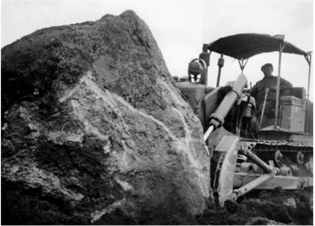
Vender tositoimissa.