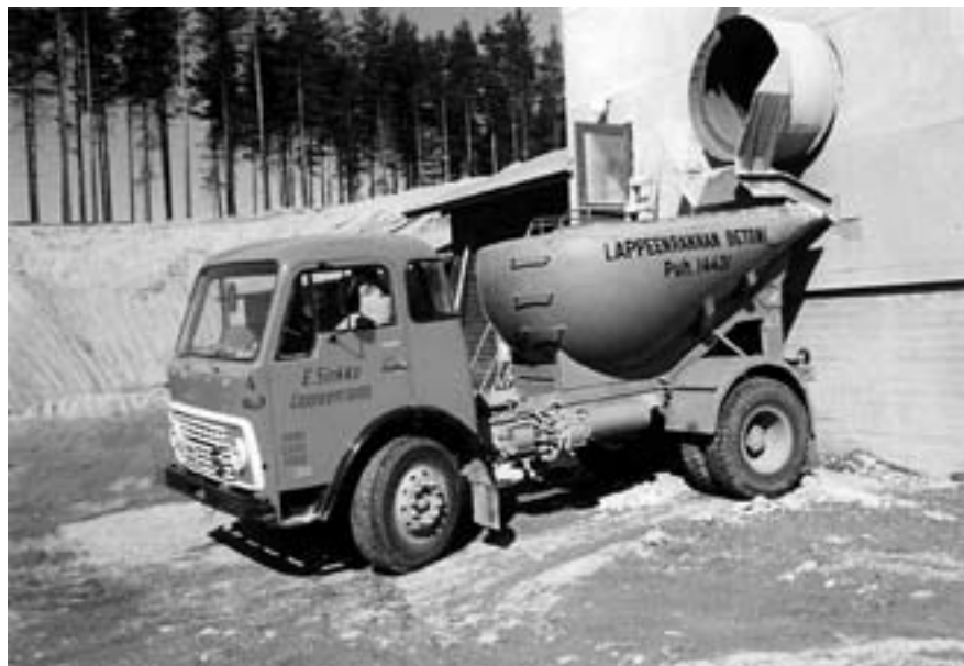
Kuoppa-auto oman hallin työmaalla 1970-luvulla.