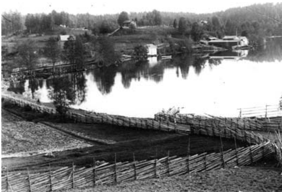
Suntianlahden rannalla näkyvät Hovinrannan mylly ja saha oikealla ja Tikan nahkurinverstas siitä vasemmalle.

Myllytupaa vuokrattiin asutokäyttöön oston jälkeen, ja se oli myös perheen asuntona uuden talon rakentamisen aikana vuosina 1939–43. Rakennus purettiin täysin lahoutuneena vuonna 1962.