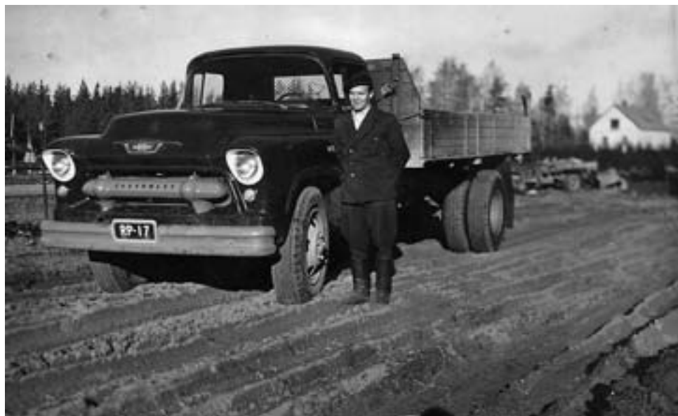
Eino Sinkko ja Chevrolet Ampujalan tietyömaalla Taipalsaarella.