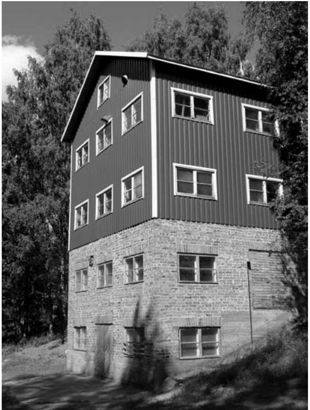
Toukkalan mylly nykyasussaan. Se toimii edelleen, mutta osa-aikaisesti.