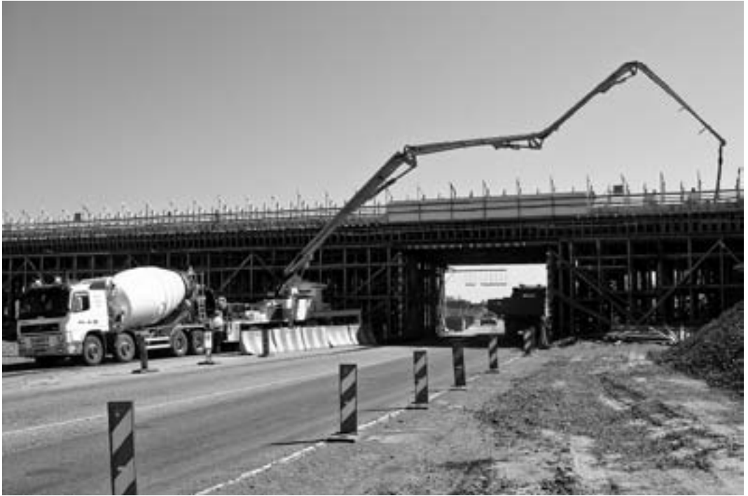
Transsinkon betoniautot Valtatie 6:n työmaalla.