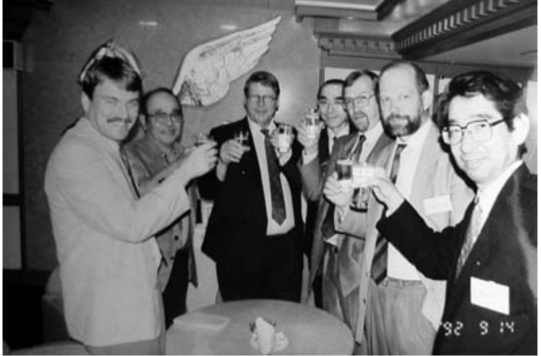
Misan kauppoja skoolataan Singaporessa.