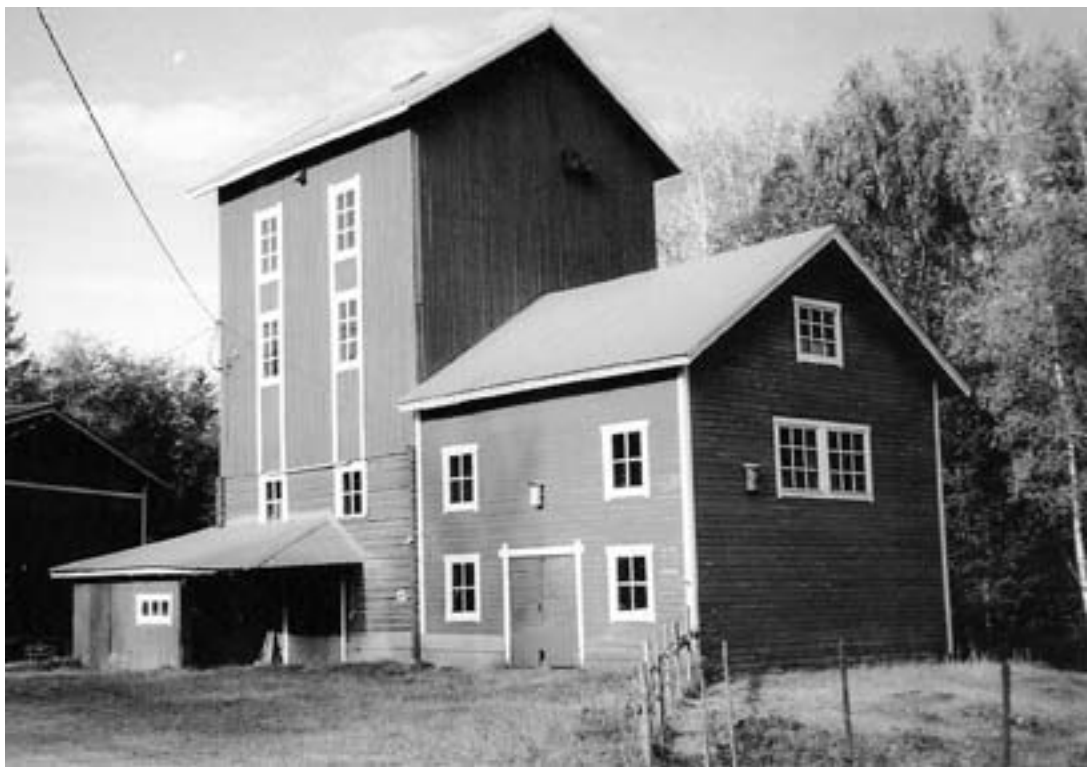
Tuuliaisen vanha mylly vuoden 2004 asussa.