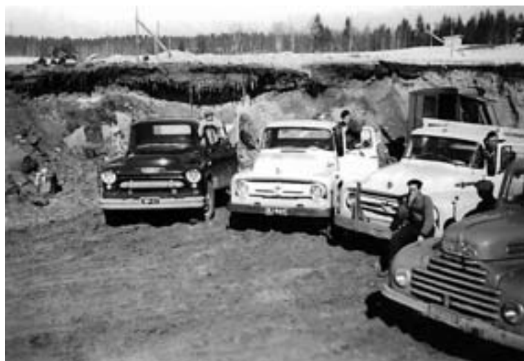
Kalustoa ja kuljettajia työmaalla Haminassa 1960-luvulla.