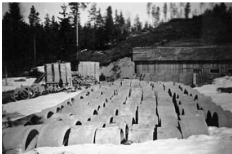
Kapiaisen valimon tuotantoa. Kuva: Oiva Kapiaisen albumi.